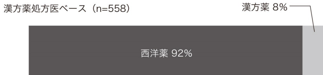
[図14-2] 内服薬の全処方数における割合