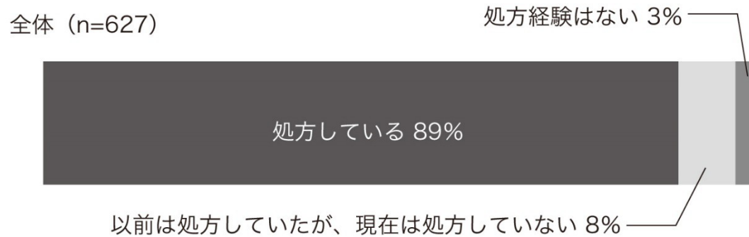
[図13] 漢方薬の処方状況